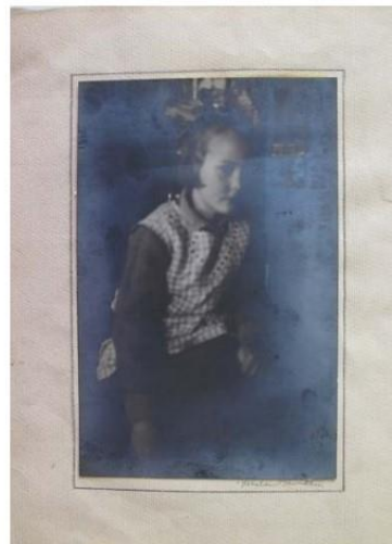
Myndir 12, 13: Ljósmyndir með silfurútfellingu. Ef silfurútfelling þekur negatífu getur það orðið til þess að hún „lokist“ þannig að ekki verði hægt að gera ljósmynd eftir henni.

Mynd úr Handbók um varðveislu safnkosts.